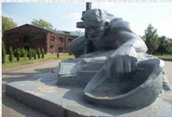
Скульптурная композиция "Жажда"

До последнего сражались бойцы. Об этом говорят надписи на стенах крепости: «Прощай, Родина! Умрём, но не сдадимся!». Почти весь гарнизон Брестской крепости погиб, защищая маленький клочок родной земли. Последним защитником крепости стал майор П.М. Гаврилов. Несколько дней он сопротивлялся в одиночку. Оставшись один, 23 июля тяжело раненным попадает в плен.