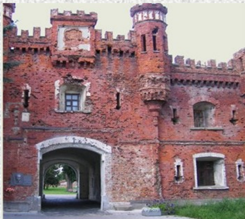
Брестская крепость. Холмские ворота.

Оборона Брестской крепости (оборона Бреста) – одно из самых первых сражений между советской и немецкой армией в период Великой Отечественной войны.