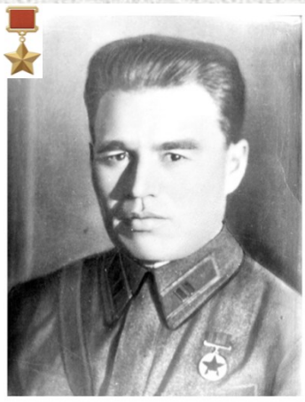
Майор П.М. Гаврилов

До последнего сражались бойцы. Об этом говорят надписи на стенах крепости: «Прощай, Родина! Умрём, но не сдадимся!». Почти весь гарнизон Брестской крепости погиб, защищая маленький клочок родной земли. Последним защитником крепости стал майор П.М. Гаврилов. Несколько дней он сопротивлялся в одиночку. Оставшись один, 23 июля тяжело раненным попадает в плен.